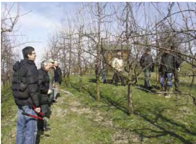
Obuka o poljoprivrednoj proizvodnji

fakultetom Univerziteta u Banja Luci i vjerovatno drugim pružateljima usluga kako bi se ponudile obuke u oblasti osnovnih vještina preduzetništva, izrade poslovnih planova, poslovnih udruživanja i poljoprivredne proizvodnje.