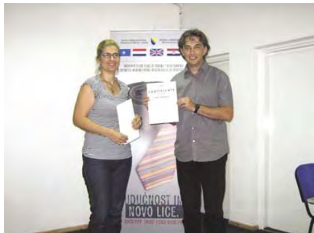
Obuka o biznisu