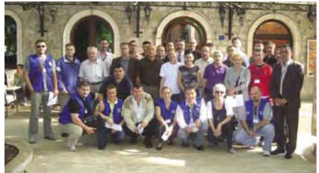
Radionica NTF-ove izlazne strategije u Trebinju

Objе radionice su ponudile učesnicima iz MO i OS priliku da bolje razumiju postupke i aktivnosti koje će dijelom formirati proces tranzicije i reintegracije.