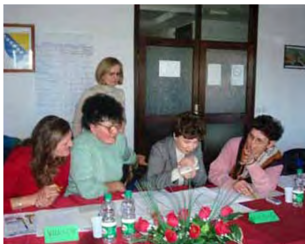
Obuka iz oblasti pravljenja biznis planova u Bijeljini