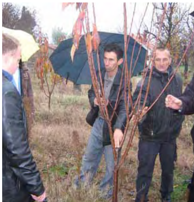
Obuka iz oblasti proizvodnje voća u Mostaru

NTF također radi sa organizacijama koje se bave obukom kako bi se organizovale obuke iz oblasti poljoprivrede. Ove obuke obuhvataju teoretska predavanja i obuku na terenu iz oblasti zadrugarstva, upravljanja farmom, uzgoja stoke, proizvodnje voća, proizvodnje povrća u staklenicima i optimiziranje upotrebe poljoprivredne mehanizacije. Do sada je 319 osoba koje su proglašene prekobrojnima učestvovalo u obukama iz oblasti poljoprivrede.