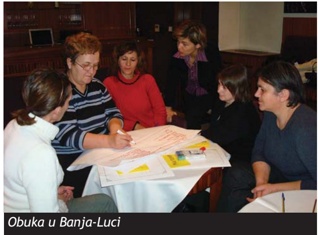
Obuka u Banja-Luci

Na kraju obuke učesnice su imale obnovljen osjećaj samopouzdanja i optimizma. Jedna učesnica je u procjeni obuke napisala: "Moje sposobnosti i kreativnost koje su spavale ponovno su oživjele; imam volju i entuzijazam i nove ideje."