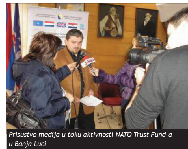
Prisustvo medija u toku aktivnosti NATO Trust Fund-a u Banja Luci

iz Bijeljine je također prisustvovao događaju. Slične aktivnosti su planirane da se održe u Bihaci i Prijedoru početkom 2009. godine.