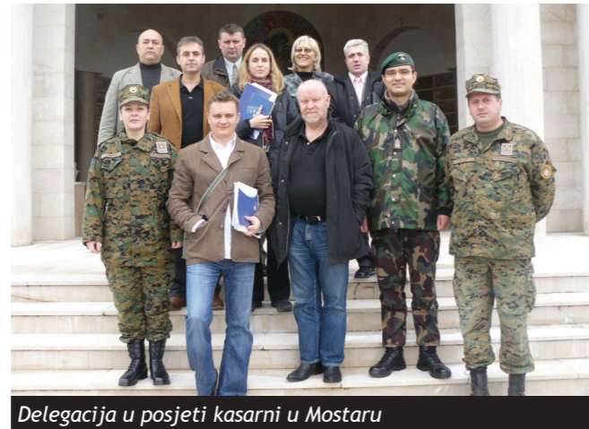
Delegacija u posjeti kasarni u Mostaru

Delegacija sastavljena od predstavnika ministarstava odbrane Norveške i Makedonije, NATO-a Sarajeva, MO BiH i IOM-a je posjetila kasarne/terenske urede u Mostaru, Banja Luci i Rajlovcu u toku januara 2009. godine. Delegacija se sastala sa predstavnicima Oružanih snaga BiH, osobljem terenskih ureda NATO Trust Fund-a, kao i predstavnicima nevladinih organizacija koje pružaju obuku iz oblasti biznisa i poljoprivrede za korisnike NATO Trust Fund-a, te je posjetila i korisnike NATO Trust Fund-a na njihovom mjestu rada.