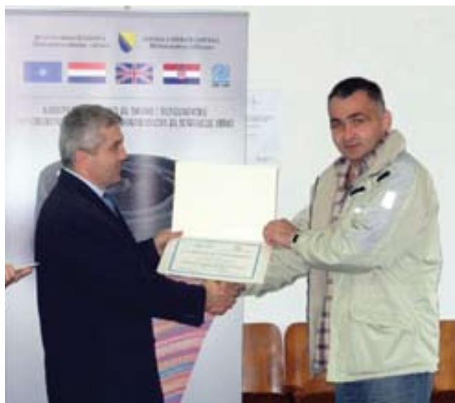
Predstavnik PTSU-a uručuje certifikat o završenoj obuci

svim relevantnim podacima i iste dostaviti Opštinama na uvid, planiranje i preduzimanje mjera i aktivnosti na zbrinjavanju lica sa njihove regije.