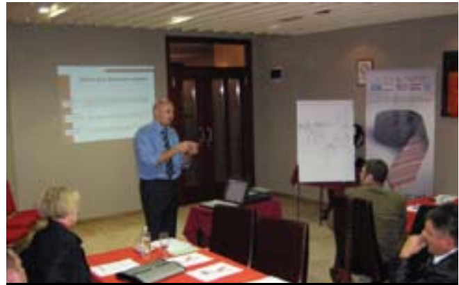
Obuka iz oblasti biznisa od strane organizacije LIR u Banja Luci

Za lica koja će u narednom periodu izaći iz sistema odbrane MO BiH će sačiniti spiskove po opštinama sa