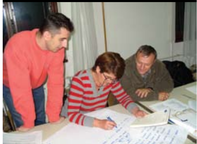
Obuka iz oblasti biznisa od strane EU TAC-a u Istočnoj Ilidži

svim relevantnim podacima i iste dostaviti Opštinama na uvid, planiranje i preduzimanje mjera i aktivnosti na zbrinjavanju lica sa njihove regije.